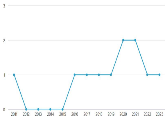
Figura 2 – Número de publicação de artigos no decorrer do período de estudo até julho de 2024.